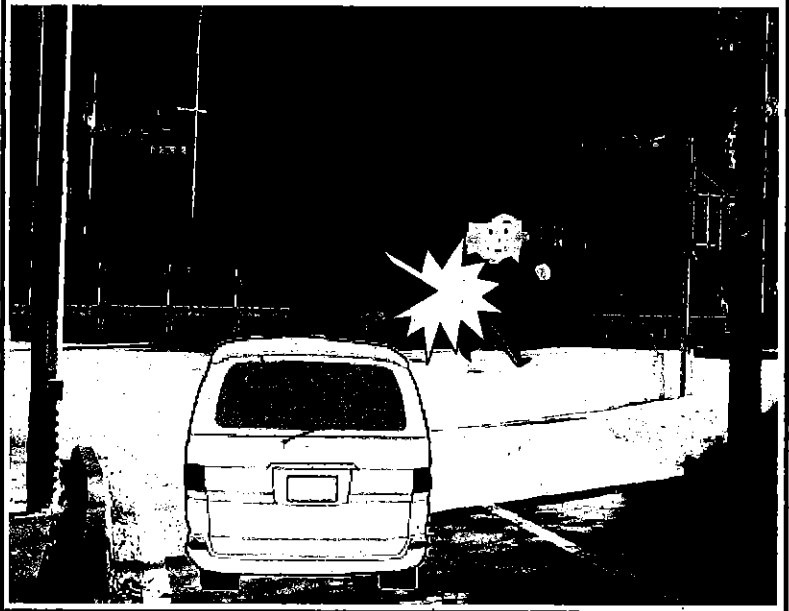
現場の見通し写真