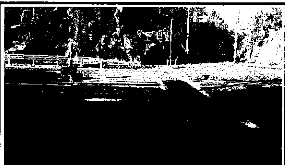
歩行者からの見通し写真